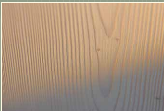
Modřín , kartáčovaný, ošetřený bílým olejem

Masivní podlaha FEEL WOOD je něco pro individualisty. Díky speciálně strukturovanému povrchu může charakter masivní podlahy ještě více vyniknout. Kartáčovaný či ručně hoblovaný povrch dává masivním podlahám nezaměnitelný vzhled. U měkkých dřevin se tím navíc zlepšuje kvalita, protože po kartáčování je povrch méně náchylný na optické poškození. Dodatečné varianty vznikají konečným ošetřením a kombinacemi barevných olejů.