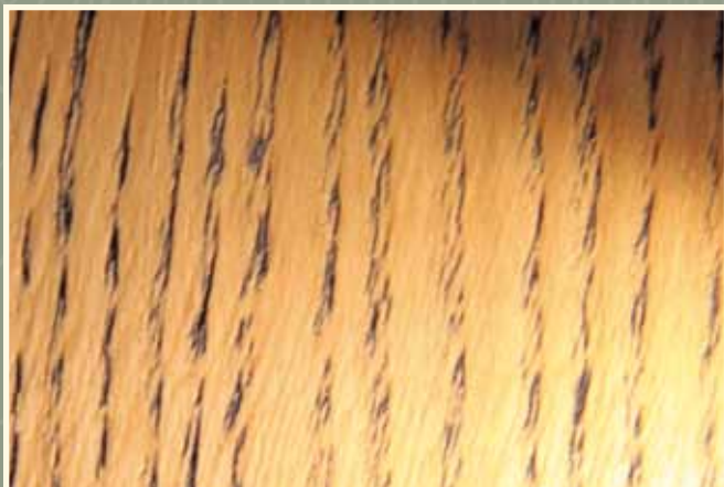
Dub , kartáčovaný, postaršený, ošetřený černým olejem

Masivní podlaha FEEL WOOD je něco pro individualisty. Díky speciálně strukturovanému povrchu může charakter masivní podlahy ještě více vyniknout. Kartáčovaný či ručně hoblovaný povrch dává masivním podlahám nezaměnitelný vzhled. U měkkých dřevin se tím navíc zlepšuje kvalita, protože po kartáčování je povrch méně náchylný na optické poškození. Dodatečné varianty vznikají konečným ošetřením a kombinacemi barevných olejů.