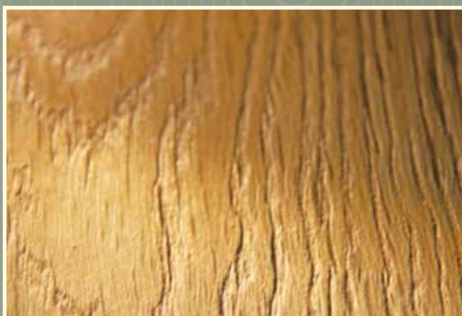
Dub , kartáčovaný, ošetřený olejem