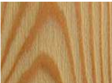
Modřín, kartáčovaný & olejovaný