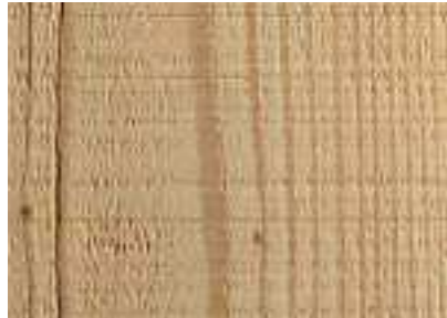
Modřín, řezaný, bílý olej