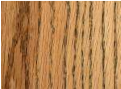
Dub, kartáčovaný, černě zestaršený & 2x přírodní olej

Další varianty vyplývají z konečné úpravy a kombinace s barevnými oleji.