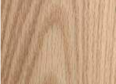
Dub, matný olej

Dřevěná masivní podlaha FEEL WOOD je něco pro individualisty. Díky speciálně strukturovaným povrchům lze charakter masivního dřeva ještě více zdůraznit. Kartáčované nebo řezané povrchy dávají dřevěným masivním podlahám nezaměnitelný vzhled.