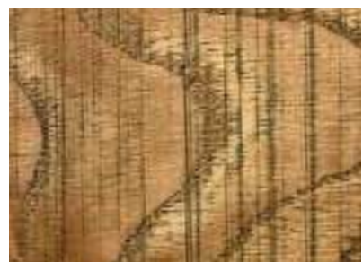
Jasan, řezaný, ušlechtilý, kouřový olej